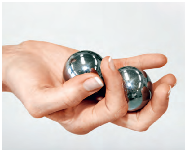
Mit gezielten Therapieübungen gilt es, die Feinmotorik der Hand zu trainieren und die Koordination zu verbessern.

Lymphödeme nach Krebsoperationen (sekundär) oder durch Fehlentwicklungen (primär) sind chronisch und verschlechtern sich ohne Therapie stetig. Für externe Patienten mit fortgeschrittenen primären und sekundären Lymphödemen steht unser Lymphologie-Team auch zur ambulanten Abklärung und für die intensive ambulante oder stationäre Behandlungsphase zur Verfügung.